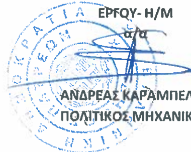
ΑΝΔΡΕΑΣ ΚΑΡΑΜΠΕΛΑΣ ΠΟΛΙΤΙΚΟΣ ΜΗΧΑΝΙΚΟΣ