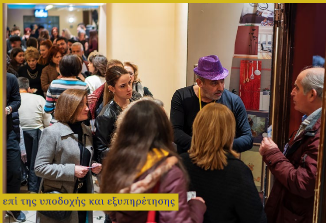
επί της υποδοχής και εξυπηρέτησης