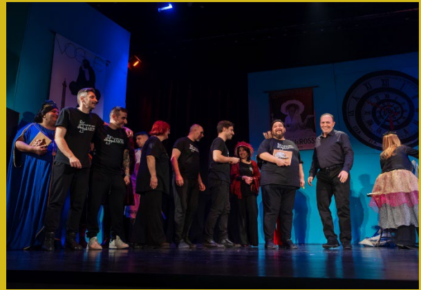
Θεατ. Ομαδ. «ΘεατρΙΛΙΟΝ» Β' βραβείο Κοινού.