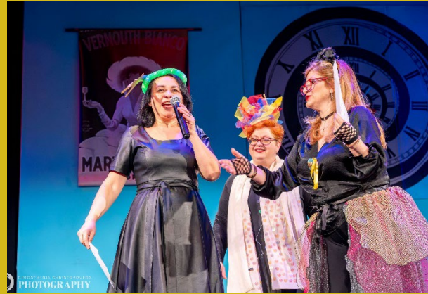
«Βραβείον Λόξης Φαιδρόν»/ Θ. Ο. Δήμου Φυλής