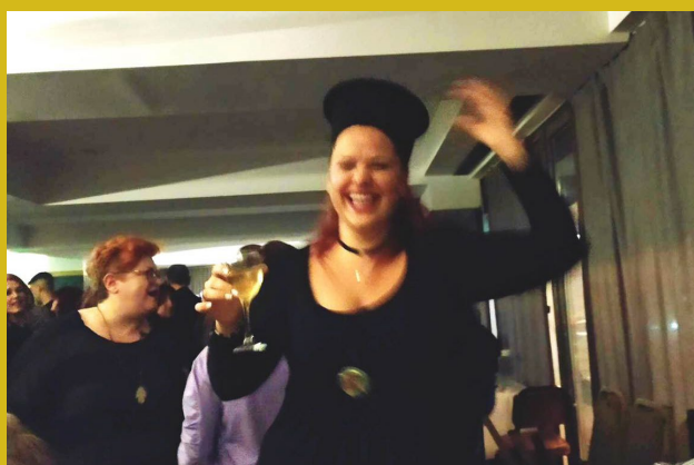
Γλέντι Σαββάτου Ξενοδ. ΑΔΩΝΙΣ/ Ειρήνη πάσι! (Αλλού ο παπάς κι αλλού τα ράσα του)