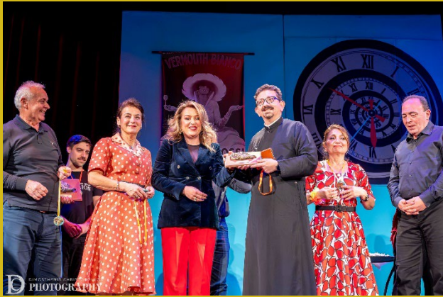
Αδελφότητα Κρητών Ρόδου Α' βραβείο Κοινού.