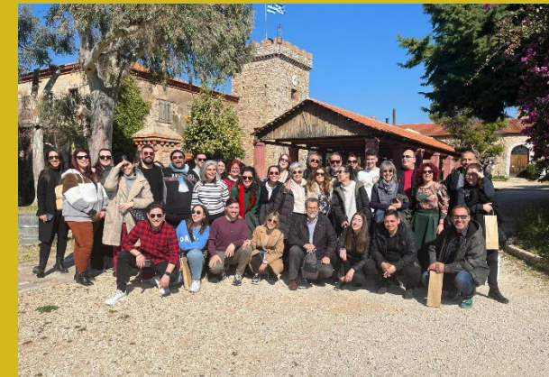
Οι ομάδες από τη Λάρισα, το Ίλιον και τη Λέρο στον Πύργο της Αχάια Κλάους, Κυριακή 18/2.