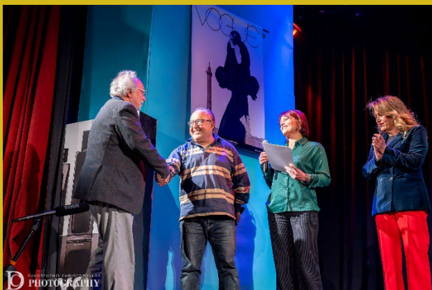
Θ.Ε. Βρυξελλών/ Τ. Νυχάς, Κριτές:/Δ.Βούλτσος, Σ. Βλαχάκη, Διευθ. ΚΕΔΗΠ/ Σ. Χρυσοπούλου