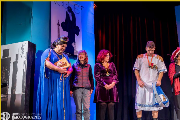
Θεατρική Ομάδα Λέρου Γ' βραβείο Κοινού.